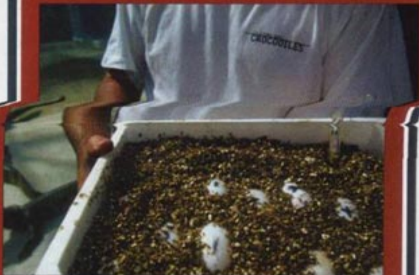
Les œufs, le nerf de la guerre. Les populations locales sont payées pour les rapporter quand ils en trouvent dans la nature.

s !" Alors on est allés près du lac avec le sorcier. Le village nous suivait. On descend dans les buissons et on entend le cri de détresse du crocodile... Le crocodile se tourne, vient directement vers moi et s'arrête à quelques mètres de la berge. Tous les crocodiles sont là, sur la colline, à attendre... Après je me suis emonté et j'ai dit au sorcier "Tu as vu, elle est venue, elle a discuté, il n'y a pas de problème, on peut aller sur le lac." Alors elle a tué un poulet, on l'a