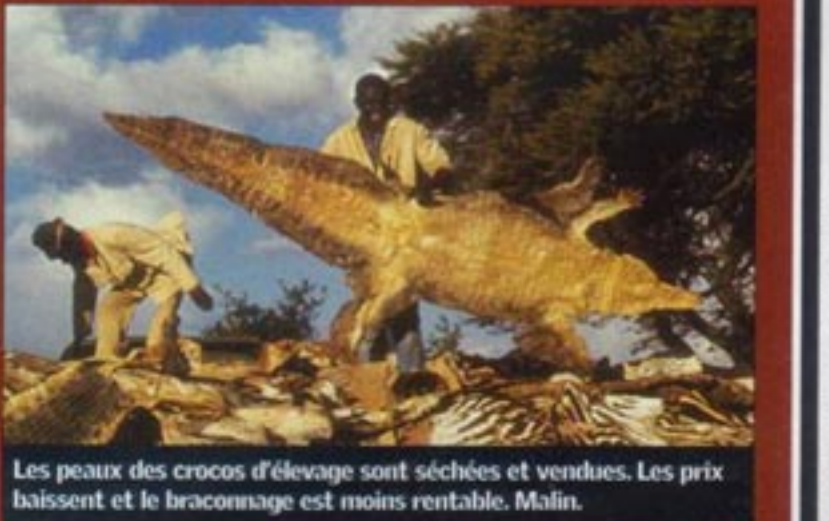
Les peaux des crocos d'élevage sont séchées et vendues. Les prix baissent et le braconnage est moins rentable. Malin.