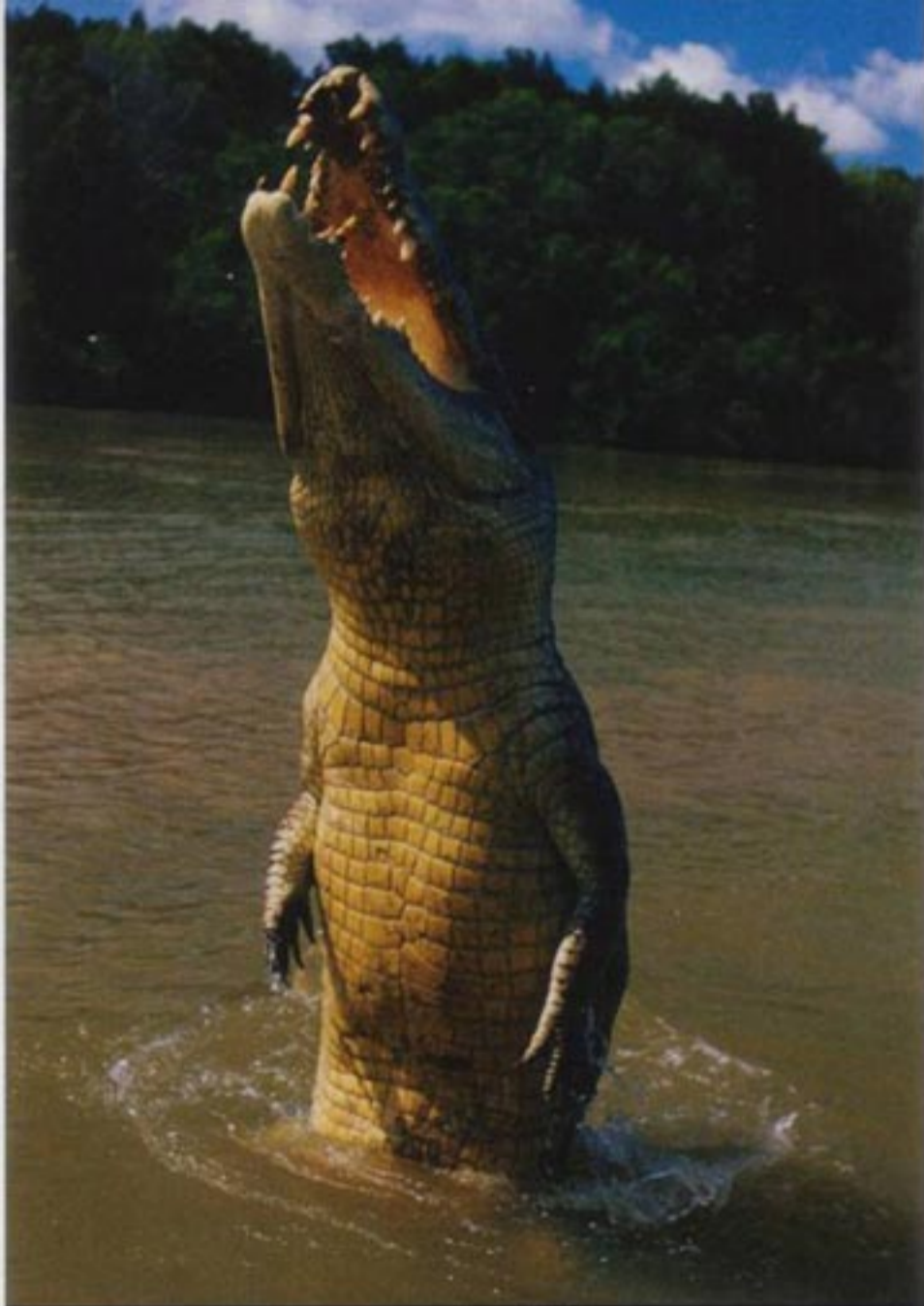
La danse des canards, gros carton dans tout le marigot...

"Tout gamin, j'ai vu les braconniers les abattre à la chaîne."